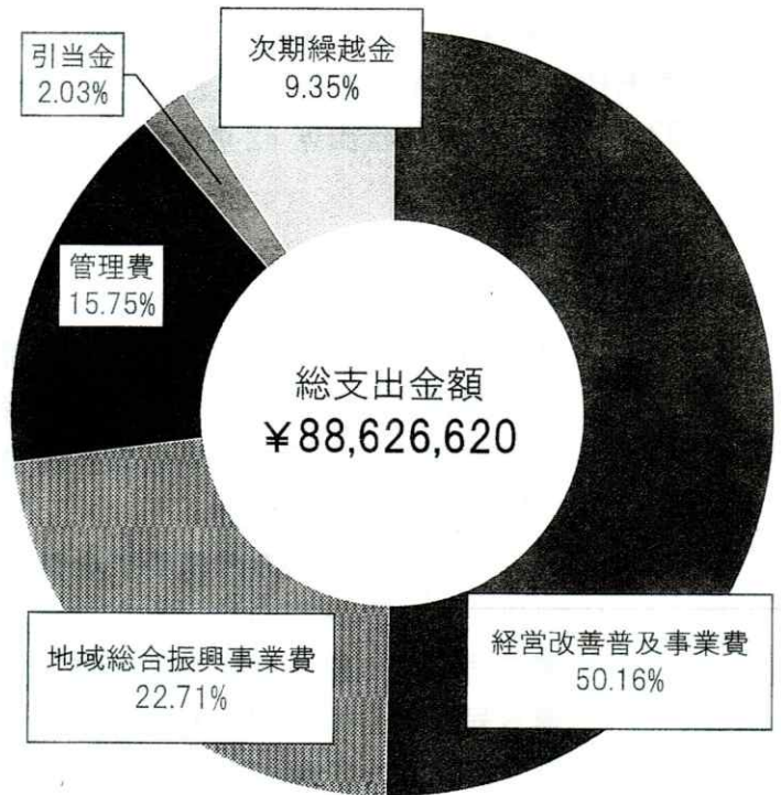
令和4年度決算 支出の部